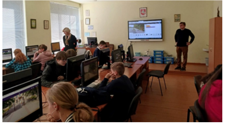
Veisiejų Sigito Gedos gimnazijos 8 klasės mokiniai supažindinami su maršrute pažymėtais atminimo ženklais. 2023 m.

Siūlome pakeliauti Lazdijų krašto literatūriniu keliu ir susipažinti su maršrute pažymėtais atminimo ženklais – įprasmintomis kūrėjų gimtinėmis ir svarbiausiomis gyvenimo vietomis.