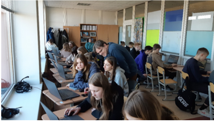
Lazdijų krašto literatūrinis kelias pristatomas Lazdijų Motiejaus Gustaičio gimnazijoje. 2023 m.