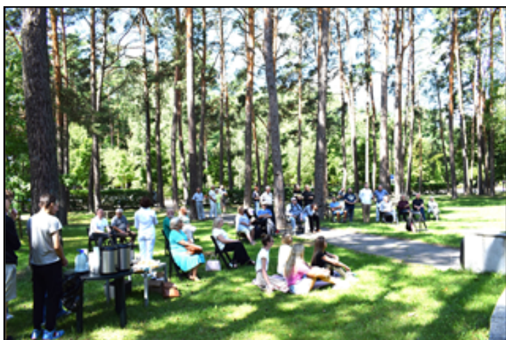
Piknikas prie Dailės mokyklos Alytaus Sąjūdžio 35-mečiui paminėti. 2023 m.