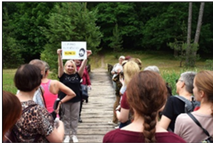
Stabtelėjimas prie simbolinio Jurgio Kunčino tiltelio. 2023 m.