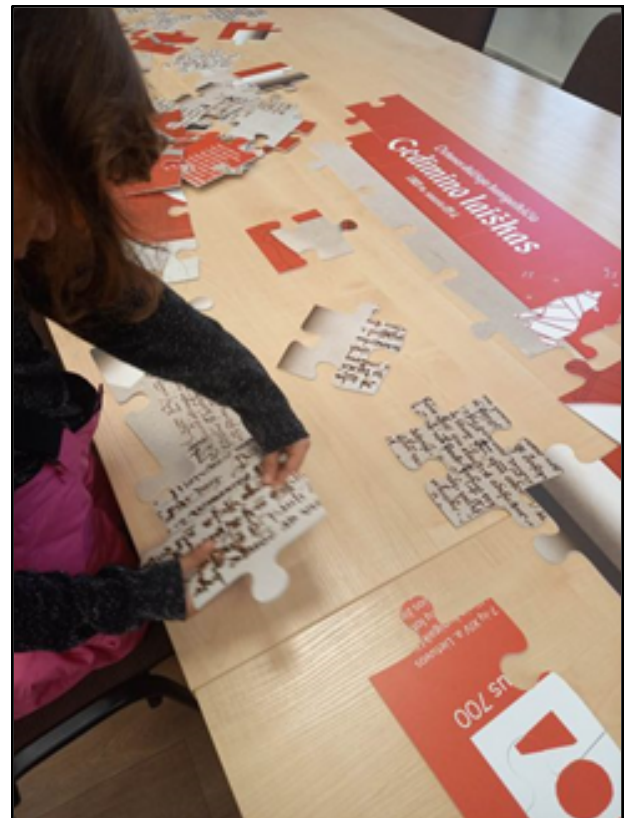
Dėlionė „Gedimino laiškas“ Vilniaus miesto centrinėje bibliotekoje. 2023 m.