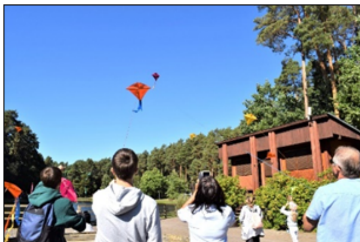
Kūrybinėse dirbtuvėse pagaminti aitvarai kilo virš Dailidės ežerėlio. 2023 m.