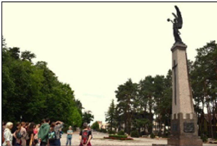
Prie Laisvės angelo paminklo – vienoje iš miesto gimtadieniui skirto literatūrinio-pažintinio maršruto stotelių. 2023 m.