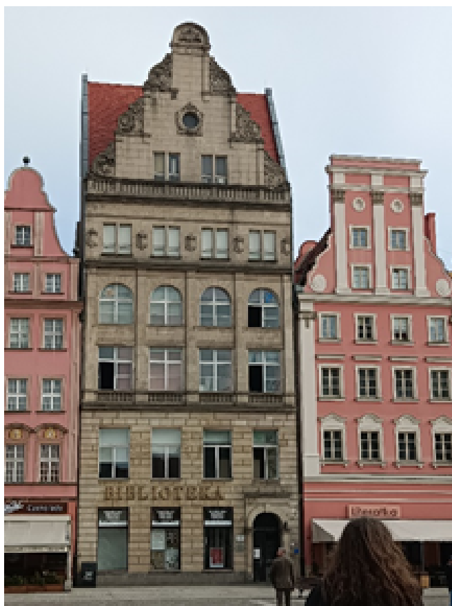
Žemutinės Silezijos viešoji biblioteka. 2023 m.