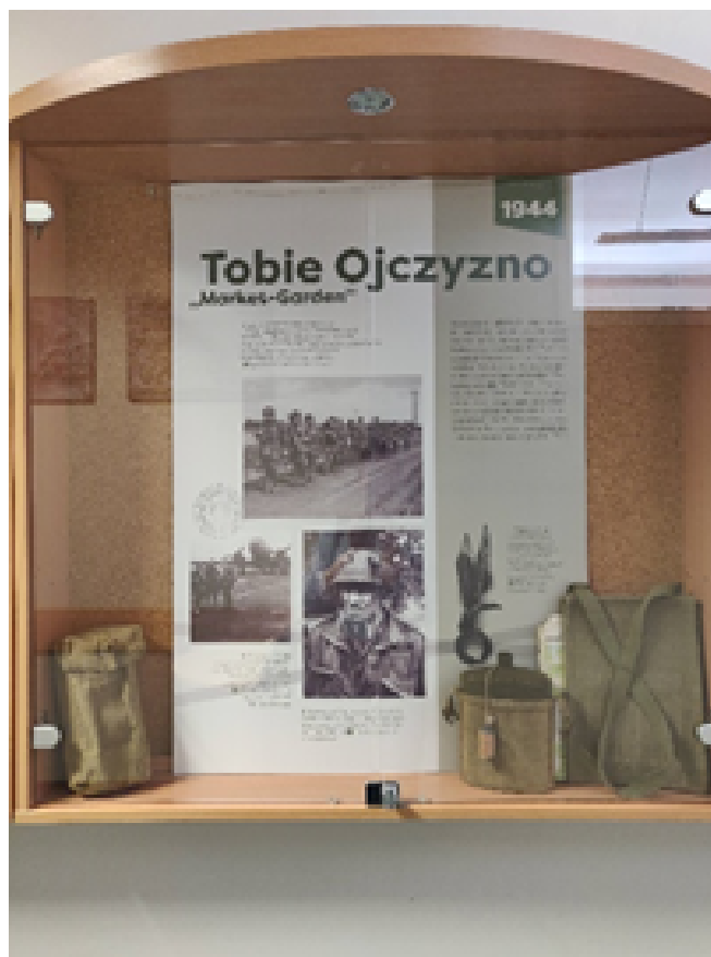
Krašto istorijos paroda. 2023 m.